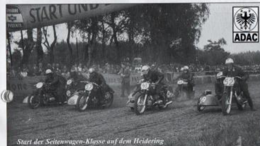
Start der Seitenwagen-Klasse auf dem Heidering